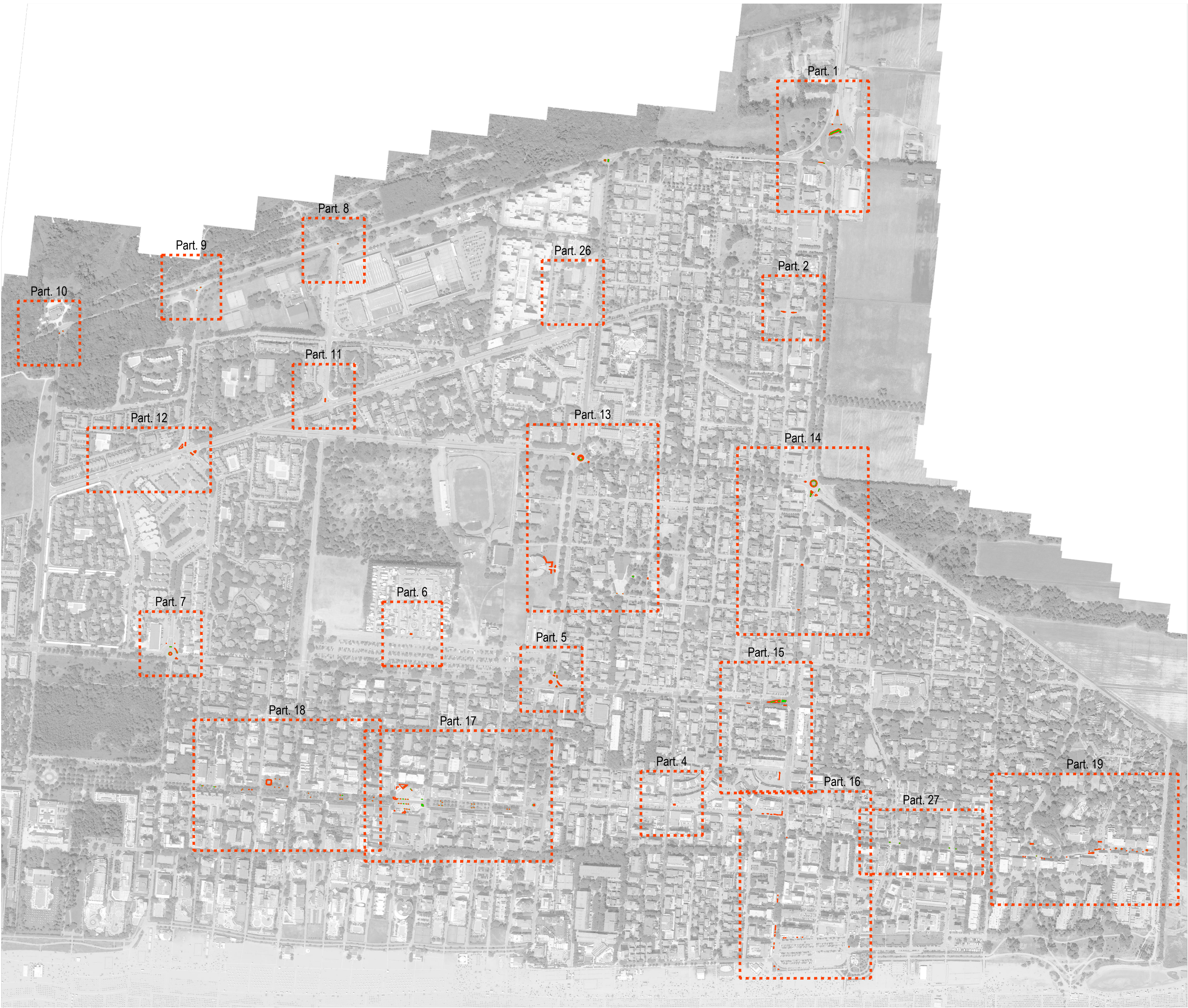
PLANIMETRIA BIBIONE CENTRO Scala 1:5.000